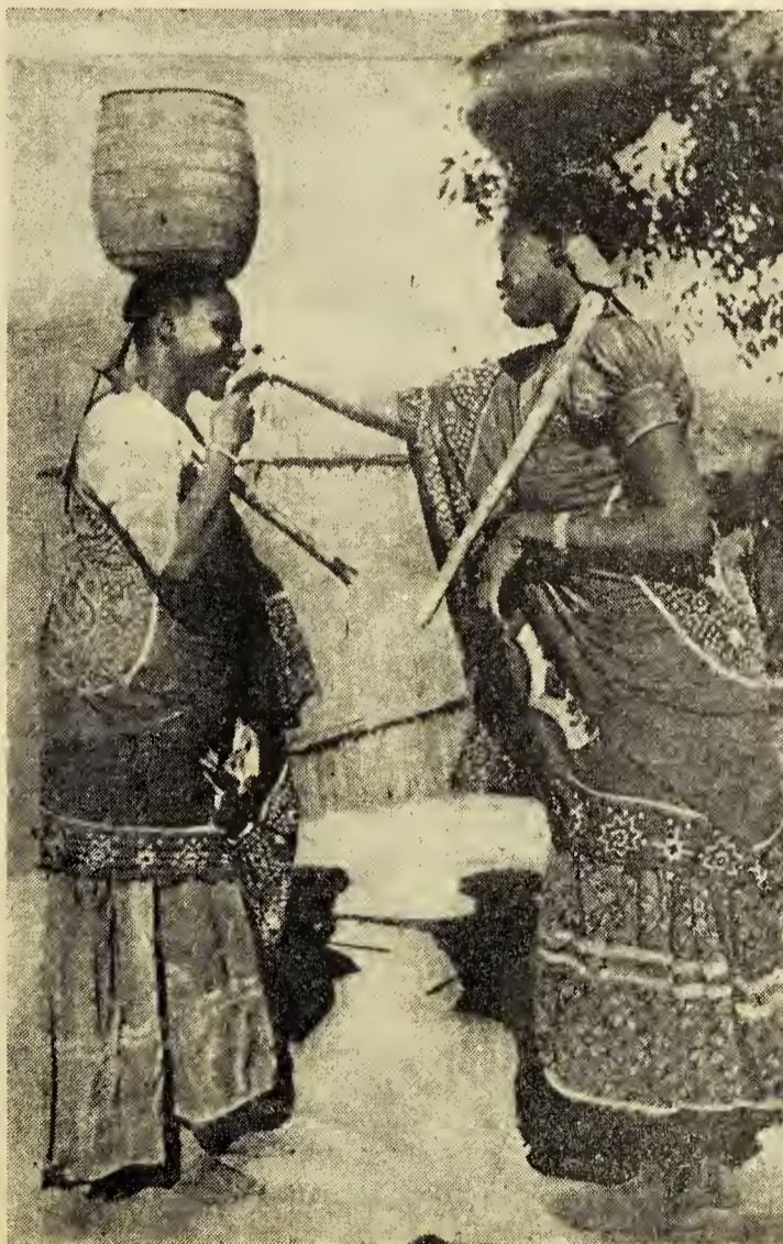
Indígenas de Zambezi (S. Africa) « Id, enseñad a todas las naciones »

Un pueblo oprimido, sufriendo, dominado por espíritus opresores... un pueblo en esclavitud. Frente a este estado de cosas hubo corazones duros, almas desapiadadas, hombres crueles,